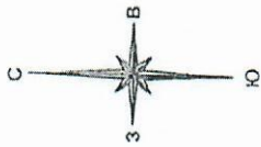
Схема предполагаемых к использованию земель и части земельного участка

Объект: Водопроводы и водоводы всех видов, для размещения которых не требуется разрешения на строительство.